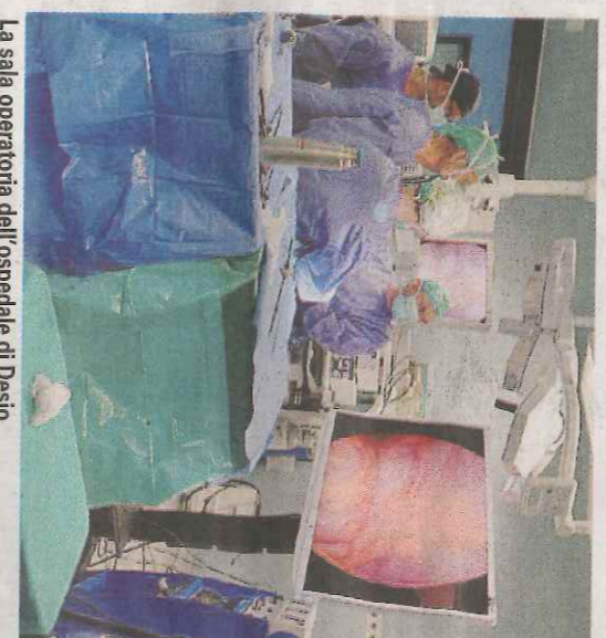
La sala operatoria dell'ospedale di Desio

retale in diretta da Svizzera e Regno Unito: Maggioni aveva eseguito un intervento in diretta di emicolectomia sinistra videolaparoscopica dalla sala operatoria dell'ospedale di Desio, durante il corso di chirurgia coloproctale dell'Advanced Minimally Invasive Surgery Academy di «Niguarda» diretta dal professor Raffaele Pugliese . «L'ospedale di Desio - sottolinea il direttore generale della Asst di Monza Matteo Stocco - è stato il primo nella Pro-