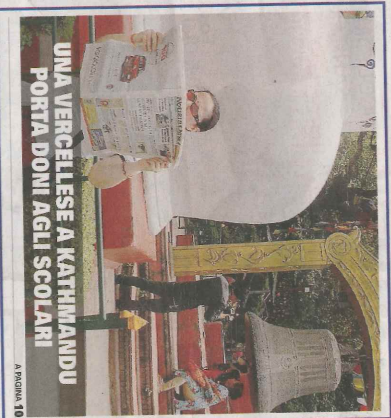
UNA VERCELLESE A KATHMANDU PORTA DONI AGLI SCOLARI